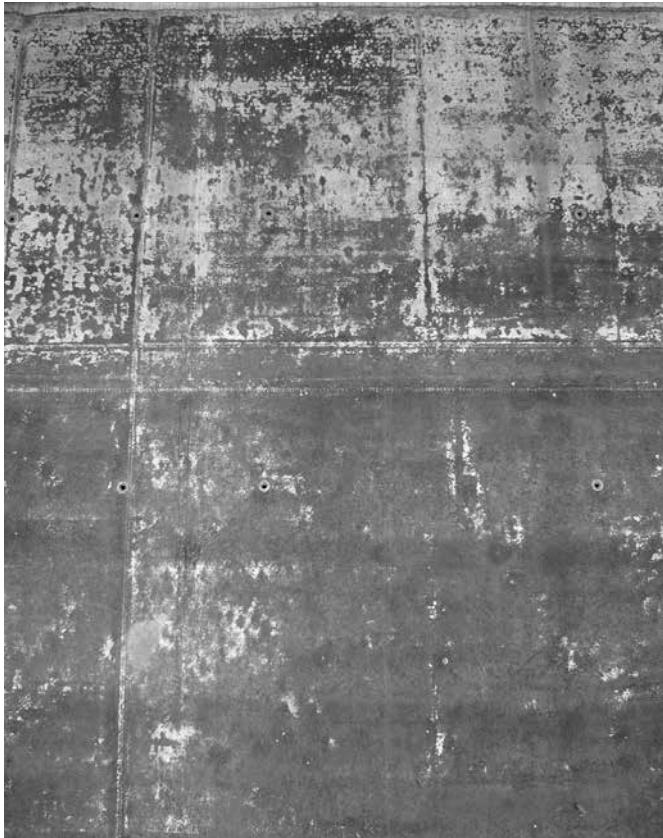
Bild 4: Ausblühungen an dunkler, im Winter betonierter Wandfläche

Beton an bevorzugten Bahnen abläuft (z. B. aus Schalungsankerlöchern, Abfluss von Wasser von der Wandkrone). Das Oberflächenwasser steht in direktem Kontakt mit dem Porenwasser des frischen Betons und besitzt einen Überschuss an Calciumhydroxid. Besonders lösungsintensiv für das Calciumhydroxid im Beton ist Regen- und Tauwasser, da diese Wässer noch keinen oder nur einen geringen gelösten Mineralgehalt haben.