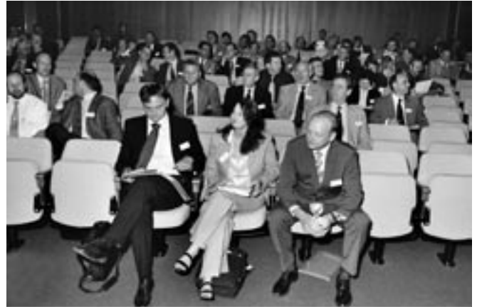
Das Auditorium im Vortragssaal des Forschungsinstituts bei der Fachtagung Emissionshandel am 06.04.2004

Die „Umweltdaten der deutschen Zementindustrie“, mit denen eine umfassende, laufend aktualisierte Dokumentation umweltrelevanter Daten der deutschen Zementindustrie vorliegt, wurden auf Basis der in den Jahren 2002 und 2003 erhobenen Daten fortgeschrieben, so dass mittlerweile bereits die 6. Ausgabe vorliegt. Ebenso fortgesetzt wurde der CO 2 -Monitoring-Report, dessen 7. Ausgabe mit Berichtszeitraum 2000 bis 2003 im Februar 2005 erschien.