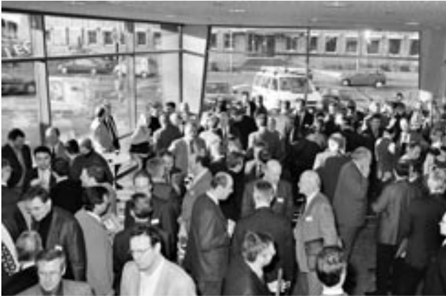
Teilnehmer an der Fachtagung Zementverfahrenstechnik am 19.02.2004 während einer Pause im Foyer des Forschungsinstituts